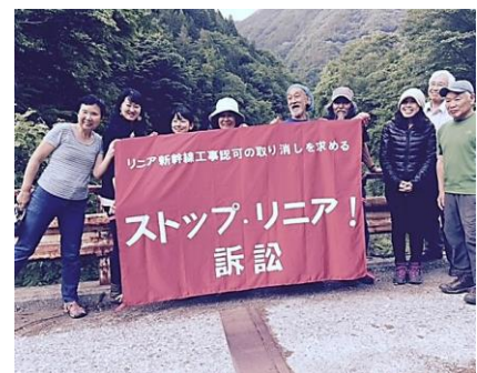
奥の溪谷にリニアの橋が

大鹿村には「大鹿村の100年先を考える会」があり、自分たちの故郷である地元の人と自然との共生を持続させようと努力しています。肩肘張った姿勢ではなく自然体で自分たちの来をつくろうと言う皆さんに励まされ、やはりリニアは大鹿村の若者たちの描く未来には全く必要ないことを知らされました。皆さんも、ぜひ伊那谷を訪れてみて下さい。(以上、天野記)